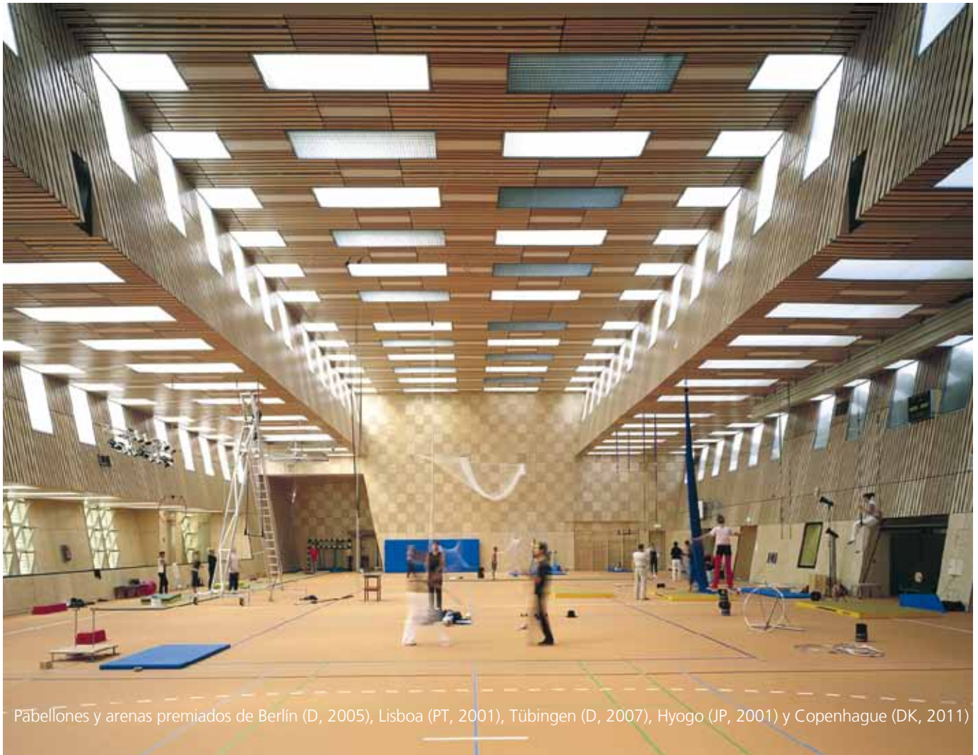
Pabellones y arenas premiados de Berlín (D, 2005), Lisboa (PT, 2001), Tübingen (D, 2007), Hyogo (JP, 2001) y Copenhague (DK, 2011)