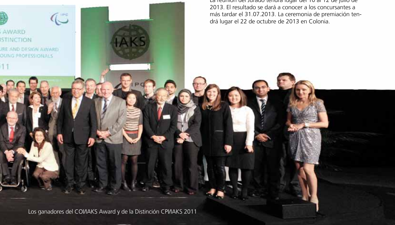
Los ganadores del COI/IAKS Award y de la Distinción CPI/IAKS 2011

La reunión del Jurado tendrá lugar del 10 al 12 de julio de 2013. El resultado se dará a conocer a los concursantes a más tardar el 31.07.2013. La ceremonia de premiación tendrá lugar el 22 de octubre de 2013 en Colonia.