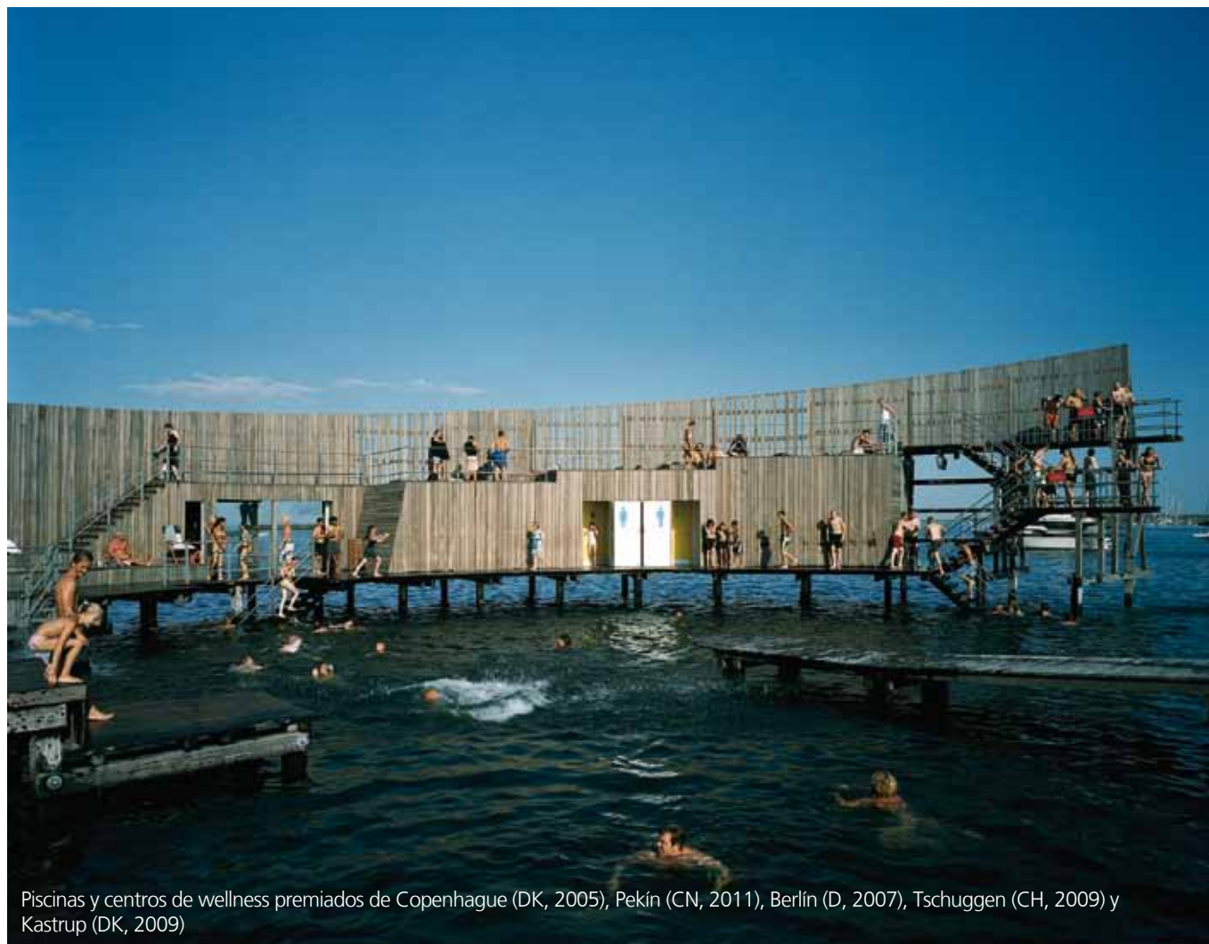
Piscinas y centros de wellness premiados de Copenhague (DK, 2005), Pekín (CN, 2011), Berlín (D, 2007), Tschuggen (CH, 2009) y Kastrup (DK, 2009)