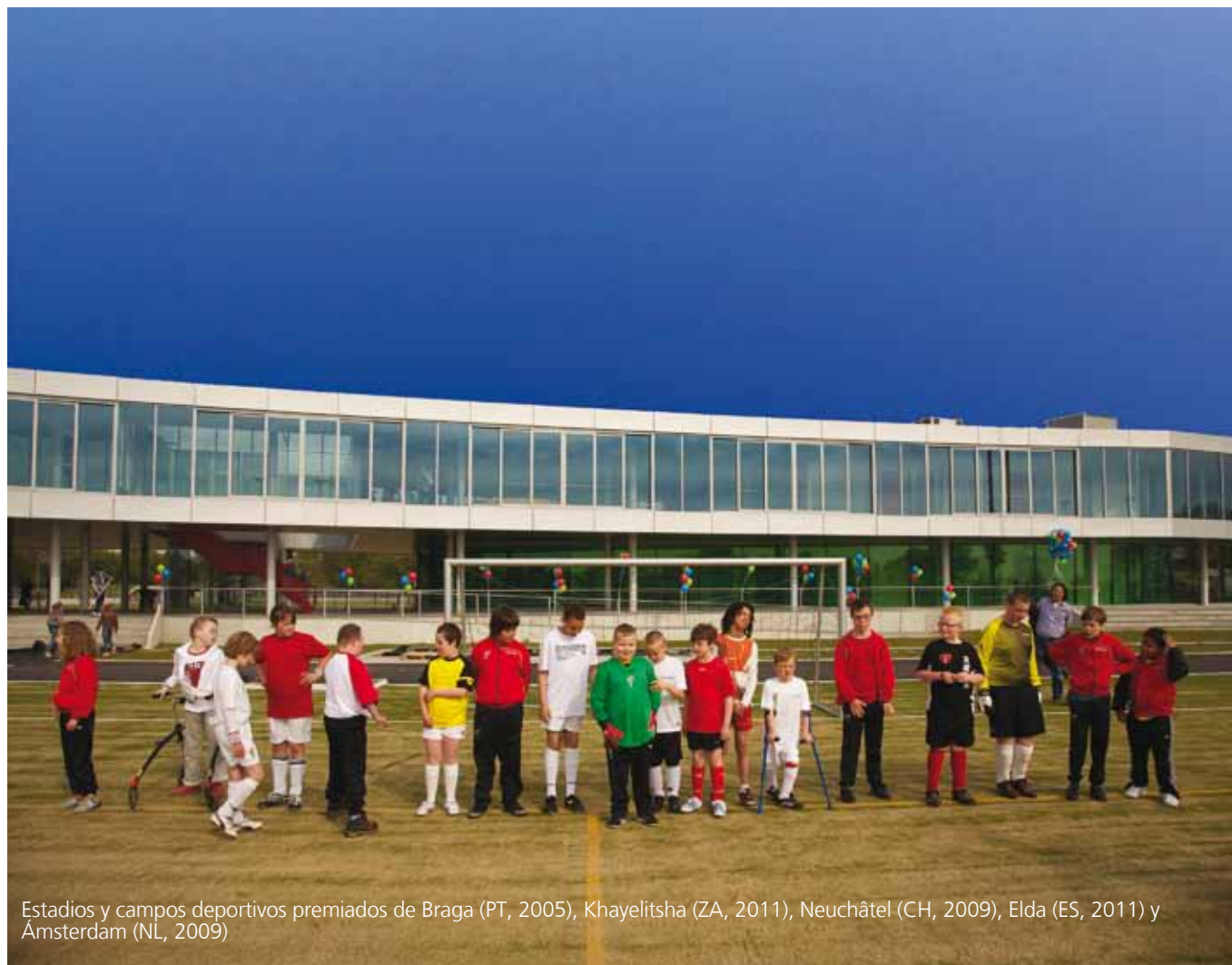
Estadios y campos deportivos premiados de Braga (PT, 2005), Khayelitsha (ZA, 2011), Neuchâtel (CH, 2009), Elda (ES, 2011) y Ámsterdam (NL, 2009)