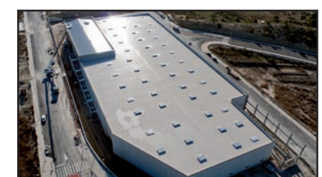
Premio “Impermeabilización con Membranas” 2011 “Cubierta Planta de Chocolates Xixona” Aplicador: Covaltia