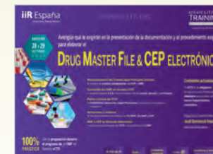
Drug Master File & CEP Electrónico Barcelona • 28 y 29 de Octubre de 2015