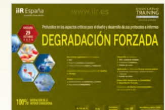
Degradación Forzada Barcelona • 29 de Octubre de 2015