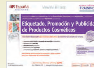
Etiquetado, Promoción y Publicidad de Productos Cosméticos Barcelona • 29 de Septiembre de 2015