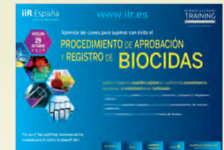
Procedimiento de Aprobación y Registro de Biocidas Barcelona • 29 de Septiembre de 2015