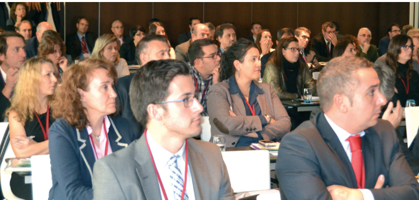
SERIALIZACIÓN y BPD