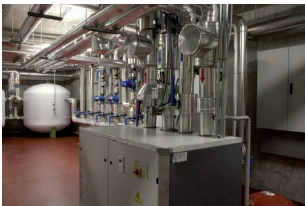
Bomba de calor agua-agua geotérmica de 80kW térmicos