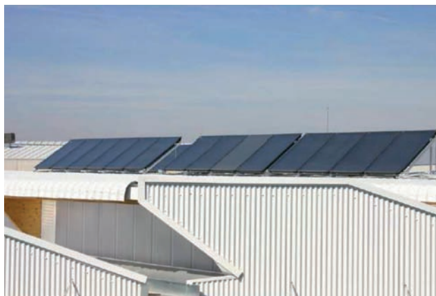
Placas solares: 70m 2 instalados

La instalación solar se compone de 25 placas solares de 2,8 m 2 cada una haciendo un total de 70 m 2 instalados en la cubierta de la nave del recinto. La energía captada por el sol se utiliza para la preparación del ACS y para la generación de frío solar en la máquina de absorción.