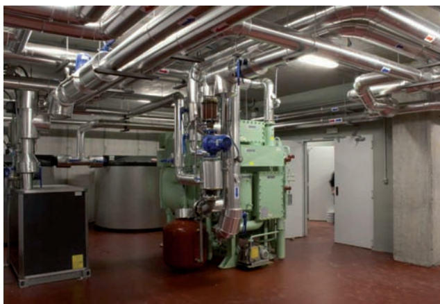
Enfriadora de agua por absorción de 260 kW