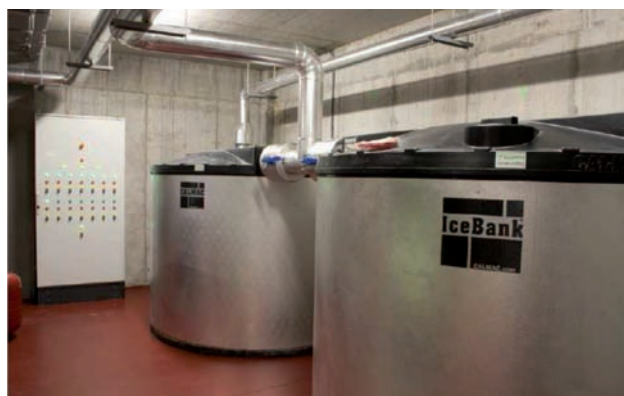
Depósito de acumulación de 8 m 3 de PCM (500 kWh)