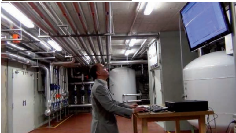
Ubicado en la sala de máquinas, el software de control completo de la instalación. Se comprobó la perfecta lectura y fácil uso de éste.