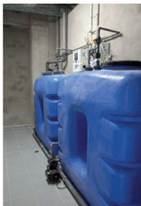
Sistema de aprovechamiento de aguas grises

tratamiento de aguas grises de los vestuarios de los talleres, para su utilización en los inodoros.