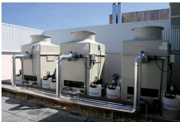
Torres de refrigeración conectadas a la máquina de absorción