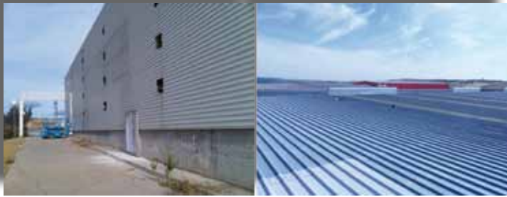
▽ Imagen 1: Fachada y Cubierta Sur del Edificio antes de la rehabilitación