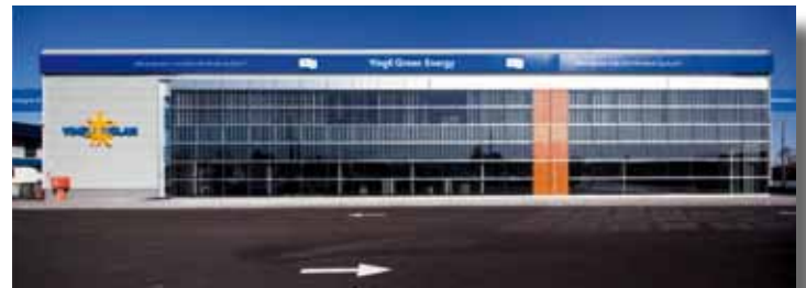
△ Imagen 3: Fachada Oeste del Edificio antes de la rehabilitación