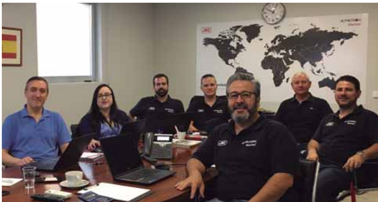
Equipo de JRC Alpatron Marine Iberia

Recientemente, Alpatron Marine Iberia ha obtenido el Certificado ISO 9001, emitido por Lloyd's Register para la comercialización, formación, mantenimiento y reparación de equipos de electrónica naval.