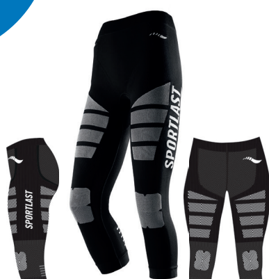
MC205NB NEGRO-BLANCO / BLACK-WHITE