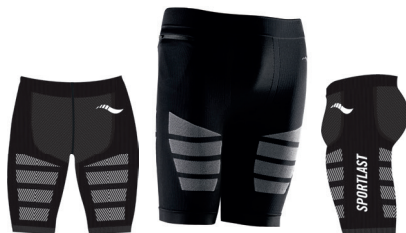
MC300NB NEGRO-BLANCO / BLACK-WHITE