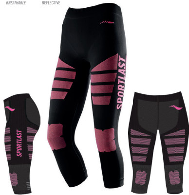
MC205NC NEGRO-CORAL / BLACK-PINK