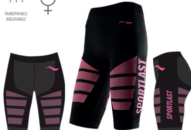
MC305NC NEGRO-CORAL / BLACK-PINK