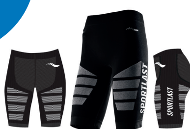
MC305NB NEGRO-BLANCO / BLACK-WHITE