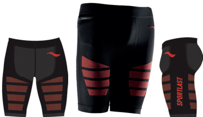
MC300NR NEGRO-ROJO / BLACK-RED